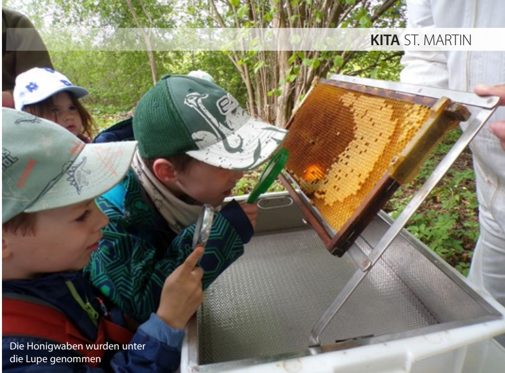
Die Honigwaben wurden unter die Lupe genommen

Text: Stefanie Motz