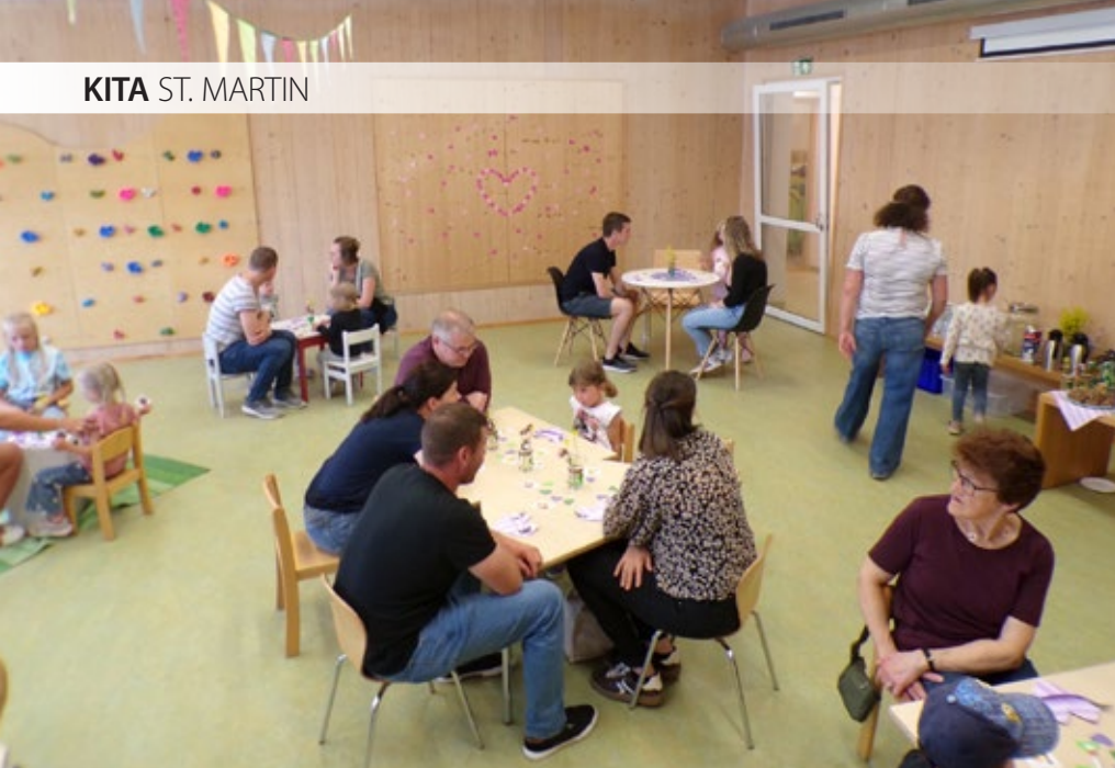
Kindercafé in der Kita-Turnhalle