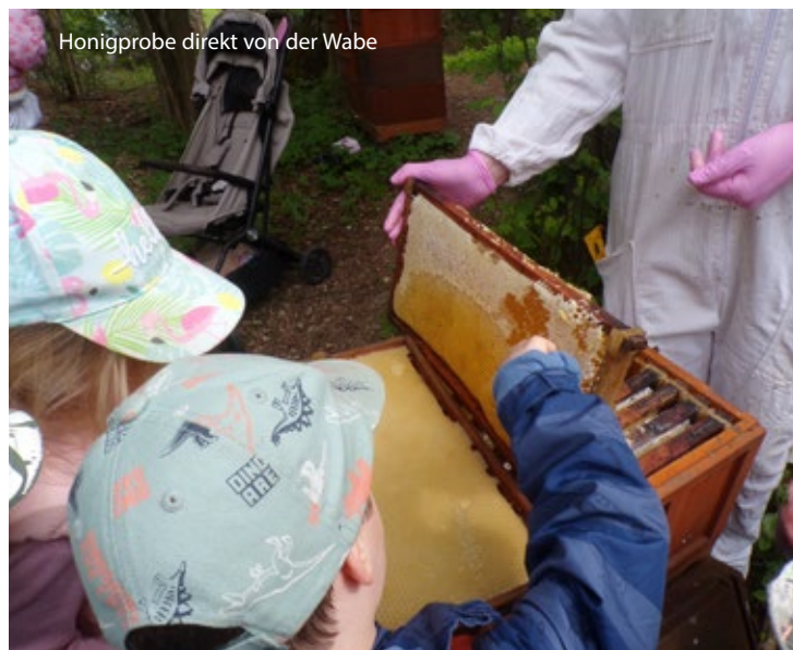
Honigprobe direkt von der Wabe