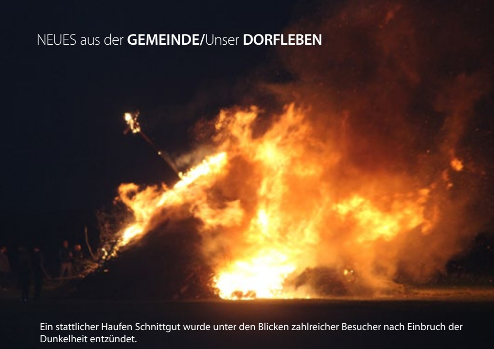
Ein stattlicher Haufen Schnittgut wurde unter den Blicken zahlreicher Besucher nach Einbruch der Dunkelheit entzündet.