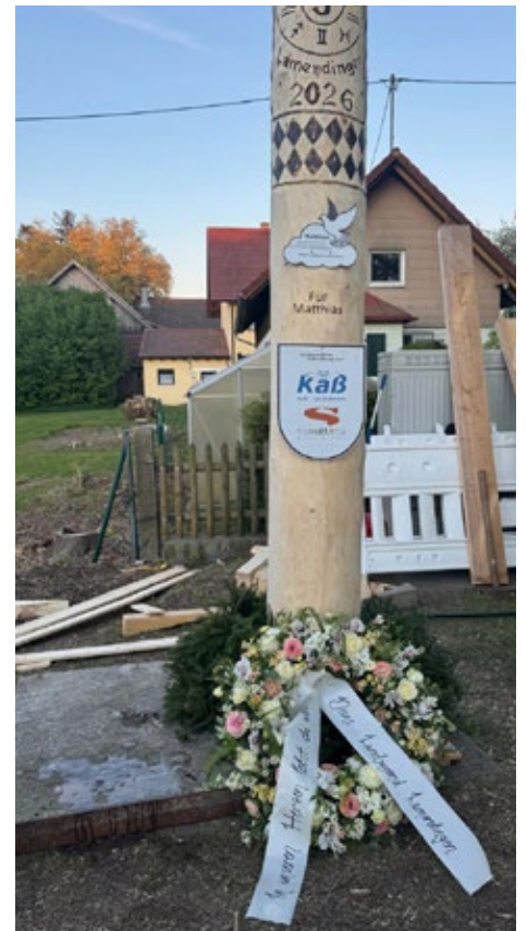
In Gedenken an Matthias