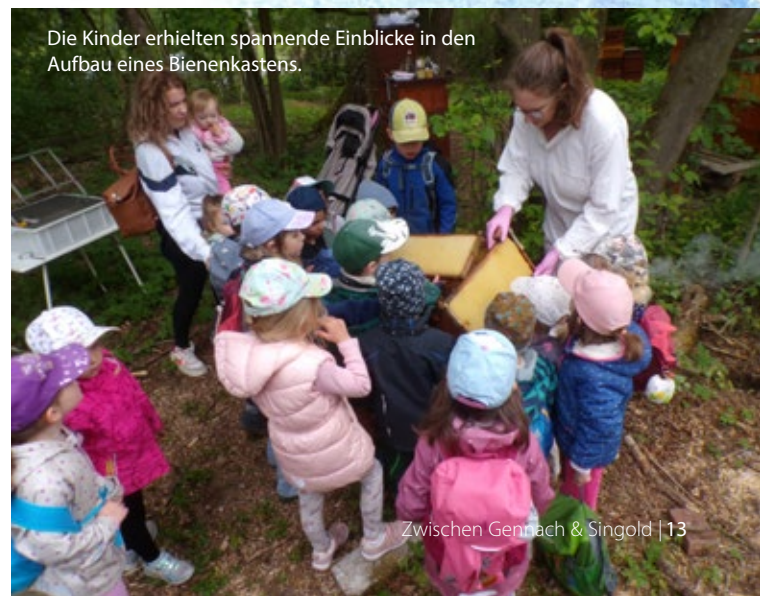
Die Kinder erhielten spannende Einblicke in den Aufbau eines Bienenkastens.