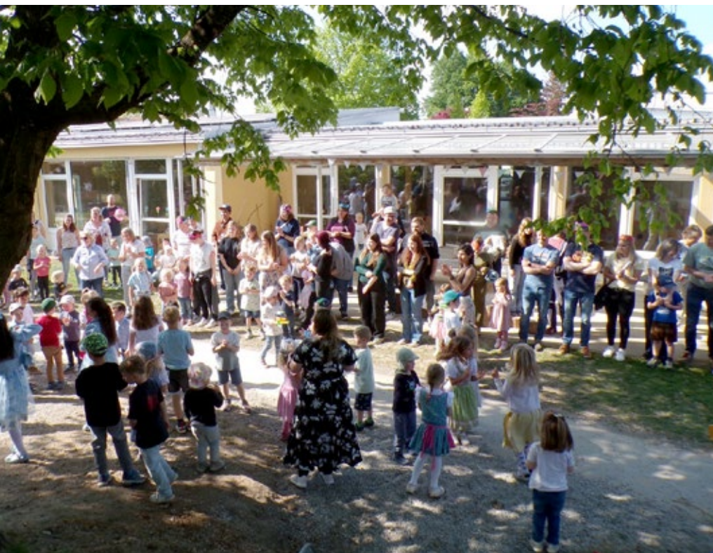
Zum Abschluss trafen sich Kinder und Gäste im Garten der Kita.

Anschließend spielten noch alle Kleinen bei bestem Wetter im Garten, während die Erwachsenen ein wenig ins Gespräch kamen. Pünktlich um 16:30 Uhr wurde die Veranstaltung mit dem Lied „Gute Laune“ und gemeinsamem Kindertanz beendet.