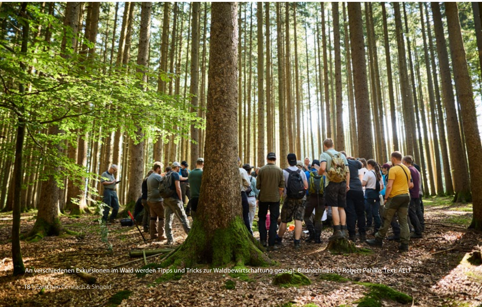
An verschiedenen Exkursionen im Wald werden Tipps und Tricks zur Waldbewirtschaftung gezeigt. Text: AELF

Exkursion, Freitagnachmittag, 24.10.2025