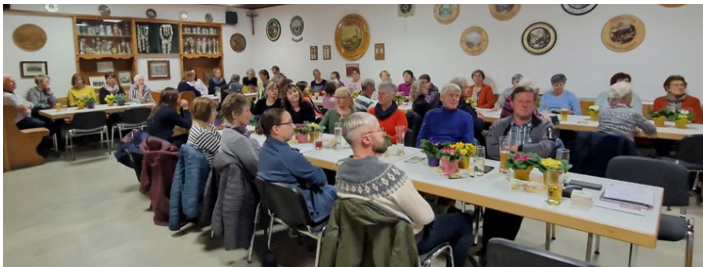
Sehr gut besuchte Jahreshauptversammlung

Zum Ende der Versammlung durfte jedes Mitglied einen Blumenstock mit nach Hause nehmen.