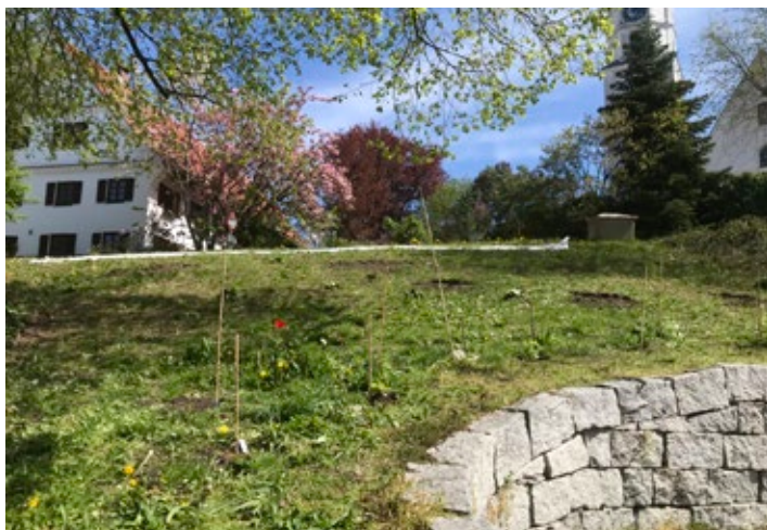
Ergebnis der Pflanzaktion