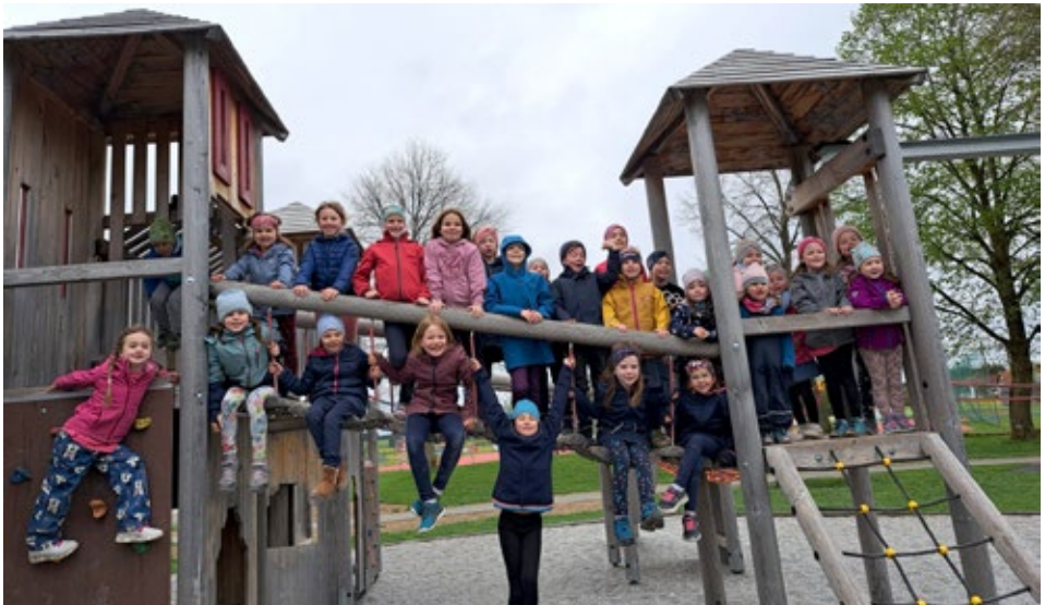
Kitzig Kids auf dem Peitinger Spielplatz