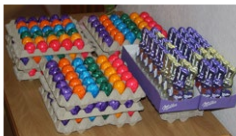
Bunt her ging es wieder einmal beim Osterschießen

Zusätzlich konnte sich jeder Schütze über einen Schoko-Osterhasen freuen. Abschließend kamen noch sechs österliche Sonderpreise unter allen Teilnehmern zur Verlosung, ehe der Abend bei gemütlichem Beisammensein ausklang.