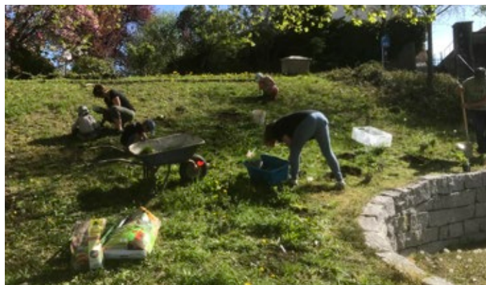
Die Gartenfreunde in Aktion