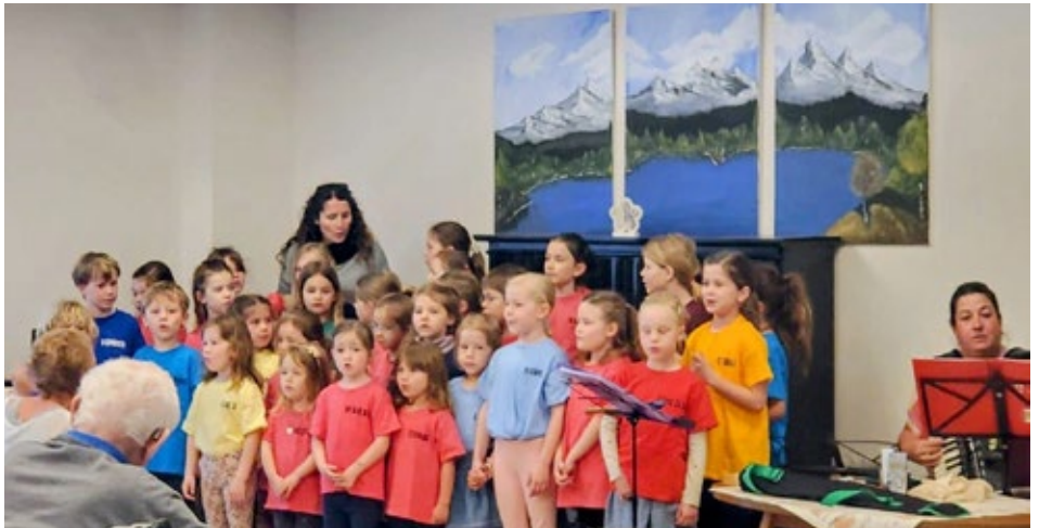
Auftritt der Kitzig Kids