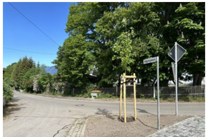
Ersatzpflanzung in Dillishausen (Angergasse)