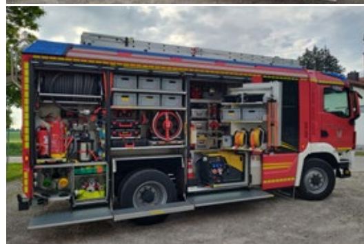
Umfassende Einblicke in unser neues LF10