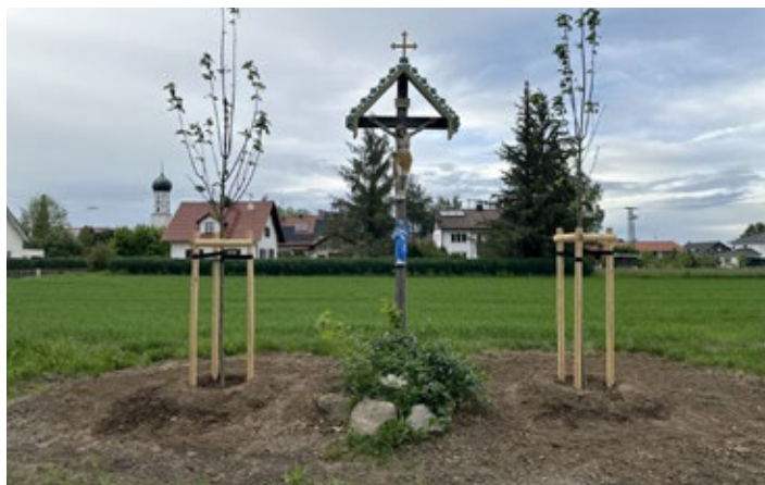
Ersatzpflanzungen am Feldkreuz Großkitzighofen

Nicht zuletzt wurde auch in Großkitzighofen kräftig gearbeitet. Statt nicht mehr standsicheren Eschen am Feldkreuz (Unteriglinger Straße) wurden dort neuerdings Berg-Ahorn gepflanzt.