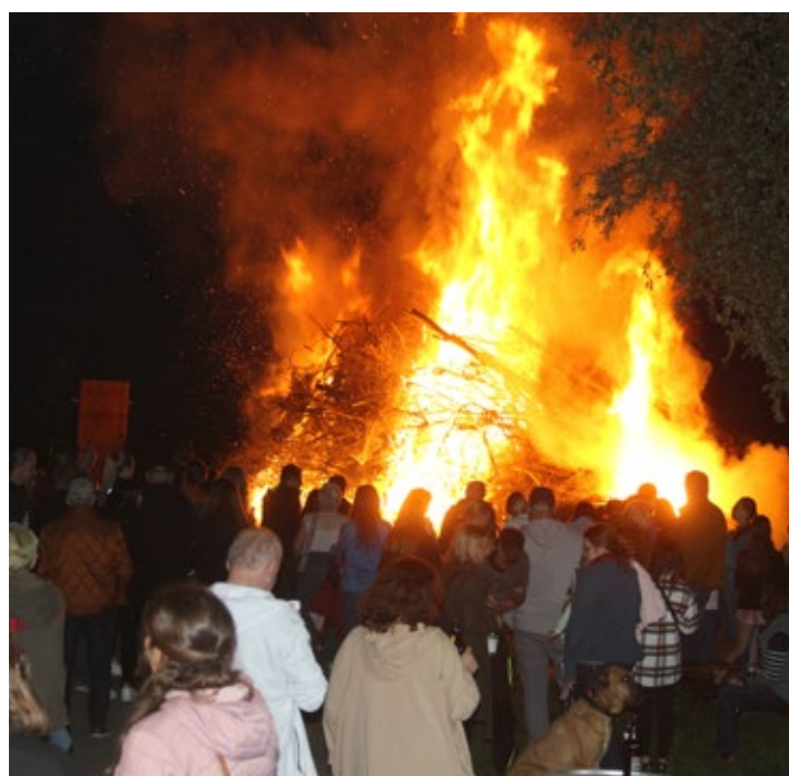
Ein stattlicher Haufen Schnittgut wurde unter den Blicken zahlreicher Besucher nach Einbruch der Dunkelheit entzündet