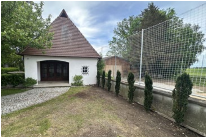
Leichenhaus Lamerdingen mit den neu gepflanzten Säuleneiben

Auf dem Lamerdinger Friedhof zieren nun Säuleneiben die Mauer entlang des Leichenhauses, welche auch als Sichtschutz dienen. Zusätzlich wurden alte Buchsbaumgewächse und Wurzelstöcke entfernt sowie zwei Hortensien und eine schöne Weißtanne an der Südseite der Kirche gepflanzt. Die Weißtanne soll zur Weihnachtszeit mit einer festlichen Beleuchtung ausgestattet werden.