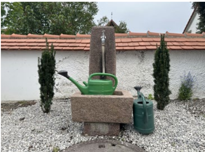
Wasserentnahmestelle am Kleinkitzhofener Friedhof

Auch in Dillishausen wurde intensiv Hand angelegt: auf dem Friedhof wurde der Vorplatz des Leichenhauses neugestaltet.