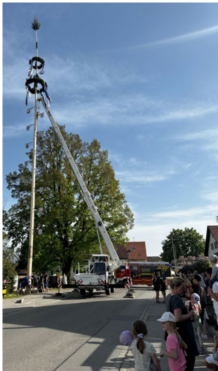
Das Maibaumaufstellen lockte zahlreiche Besucher an

Die Vorbereitungen gingen über mehrere Wochen, viele fleißige Helfer waren involviert und jetzt war es endlich so weit. Das Aufstellen unseres Maibaumes, der dieses Jahr eine stolze Höhe von 37 Metern erreicht, stand bevor.