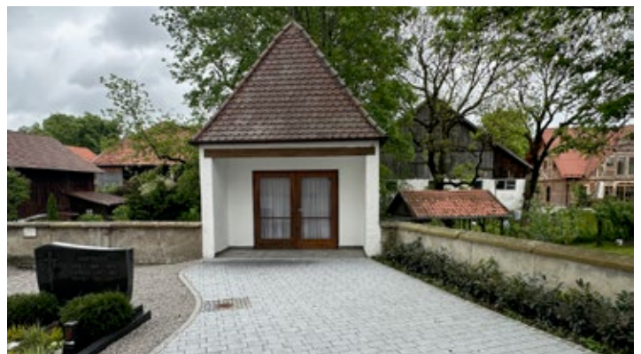
Der neu gestaltete Vorplatz des Dillishausener Leichenhauses