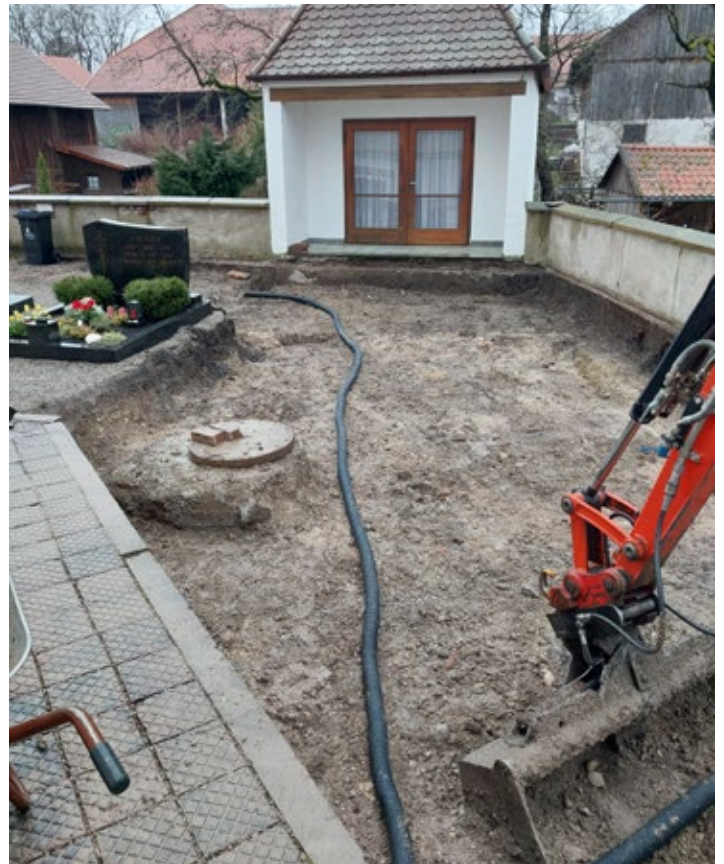
Baumaßnahmen am Vorplatz des Leichenhauses in Dillishausen