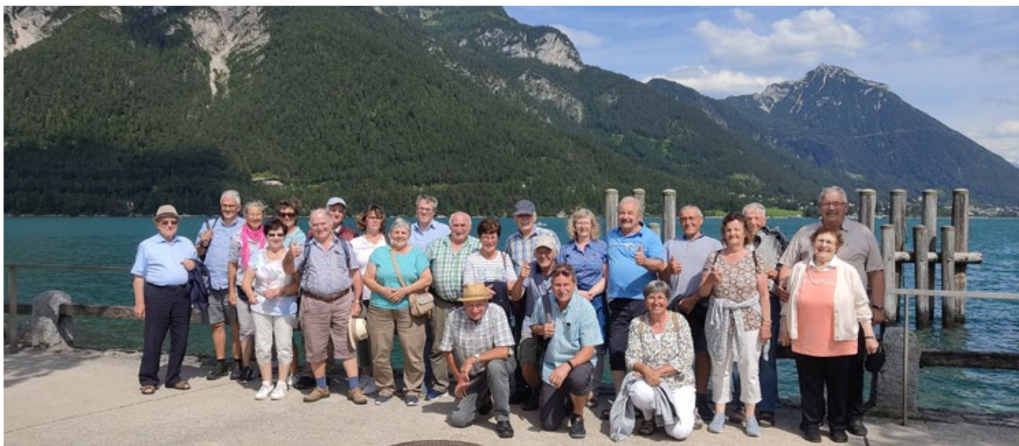
Mitglieder des Soldaten- und Kameradschaftsvereins Lamerdingen genießen die idyllische Kulisse