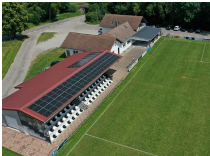
Die PV-Anlage des FSV Lamerdingen aus der Vogelperspektive: Nachhaltige Energiegewinnung