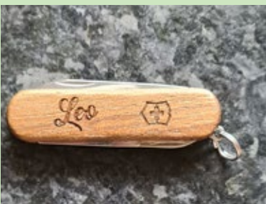
Gefunden am Spielplatz beim Lamerdinger Dorfhaus.