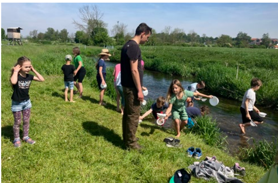
Unsere Jungfischer auf Entdeckungstour durch den Fischereihof