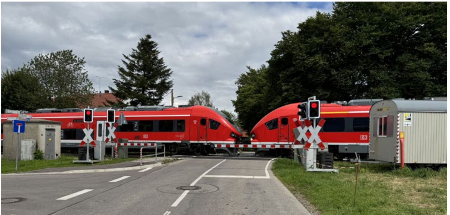
Der neue, vorrübergehende „technische Hilfsübergang“ am Bahnübergang in Dillishausen

Die Gemeinde Lamerdingen bedankt sich bei den Anwohnern für ihr Verständnis und ihre Geduld während dieser außergewöhnlichen Situation.