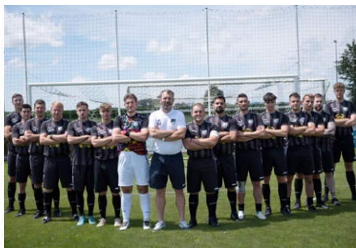
Die 2. Mannschaft mit den neuen Trikots

Unser ‚Buddy‘ ist selbst noch aktiver Spieler und ebenfalls Stadionsprecher in unserer FSV-Arena.