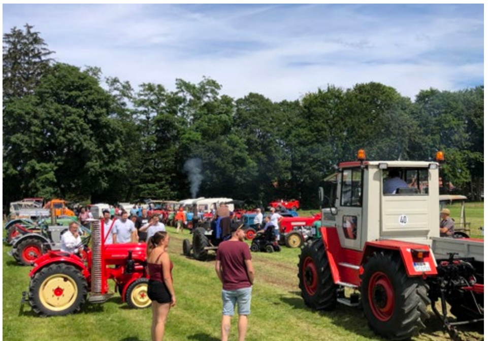
Auch kleine und große Traktoren gab es zu besichtigen