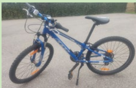
Gefunden am 22.07.2024 in Großkitzighofen am Volleyballplatz.