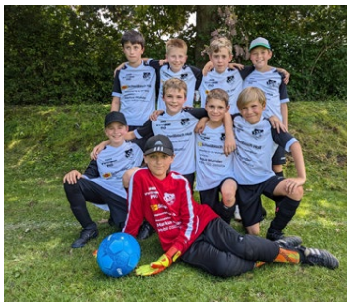
Stolze Meister: Die E-Jugend des FSV Lamerdingen